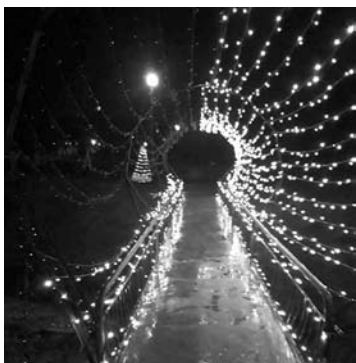
Šviečiančios girliandos buvo nutrauktos praėjus maždaug dviem valandoms po jų pakabinimo.

Euras. Prieš penkerius metus Lietuvoje įvestas euras iš dalies lėmė kainų kilimą, tačiau šios valiutos nauda gerokai viršijo sąnaudas. Euras lėmė spartesnę ekonomikos ir pajamų augimą, pigesnę valstybės skolinimąsi, atpigusius mokėjimus, teigia Lietuvos bankas. Pasak jo, po euro įvedimo išaugę Lietuvos reitingai ir sumažėjusi rizika leido šaliai skolintis pigiau. Vien dėl atpigusio skolinimosi valstybė per penkerius metus sutaupė 334 mln. eurų. Sumažėjus paskolų palūkanų naštai, gyventojai ir verslas per penkerius metus sutaupė beveik 300 mln. eurų. LB teigimu, net vertinant konservatyviai, euras šalies eksportą kasmet kilsteli bent 200-350 mln. eurų. Centrinis bankas nurodo, kad Eurostato vertinimu, litų keitimo poveikis kainoms buvo vienkartinis ir nedidelis. Infliacija 2015 metų pradžioje dėl euro įvedimo padidėjo 0,11 proc. punktu. Į Lietuvos banką kol kas nesugrįžo 428 mln. eurų grynųjų litų, kurių vertė - 124 mln. eurų. Lietuvoje euras įvestas 2015 metų sausio 1 dieną.